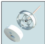
détecteur pour sol