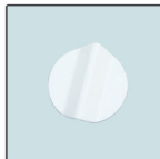
Clé d'ouverture du détecteur termites

La station piège est constituée de deux disques en Pvc qui s'emboîtent l'un dans l'autre destinée à être utilisées comme détecteur termites Sols, murs ou cordonnets.